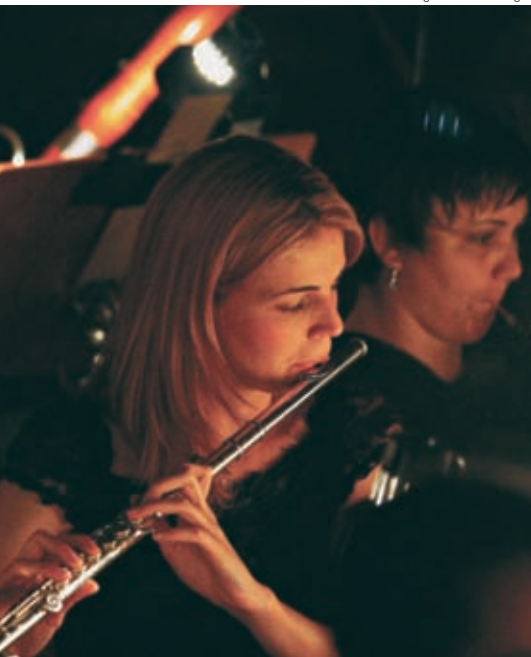
...artísticos, culturais e de ação social, diz pesquisadora