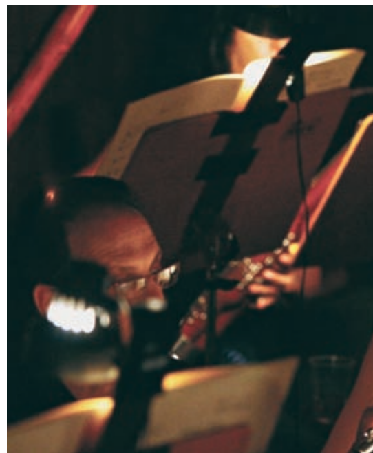
Grupos cada vez mais se conectam para intercâmbios...